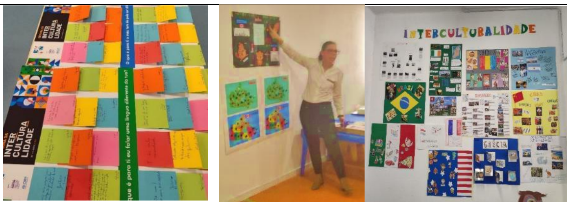
Semana Sem Fronteiras

Em celebração dos 50 anos do 25 de Abril, o desfile de Carnaval de Moscavide, que havia sido adiado devido às condições meteorológicas, foi realizado no dia 23 de abril. Os participantes desfilaram pelas ruas de Moscavide, exibindo fantasias coloridas de acordo com a temática, acompanhados por muita música e diversão.