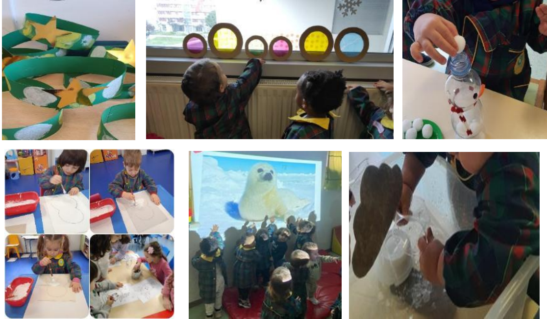
Atividades de exploração sensorial e expressão plástica, artística e motora