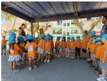
Comemoração Dia dos Avós