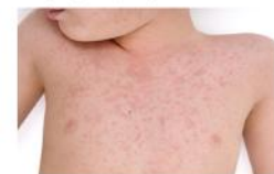
Figura 2 – Urticária localizada no tronco e região maxilar (criança)