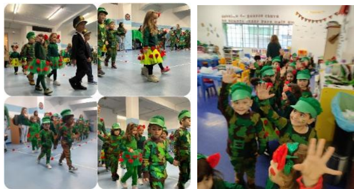
Desfile de Carnaval: 50 anos da Revolução dos Cravos