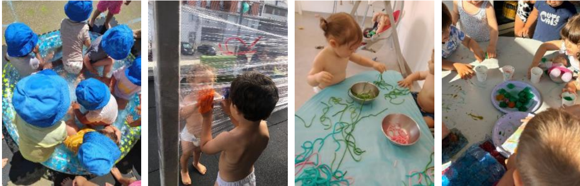
Atividades lúdicas e pedagógicas ao ar livre