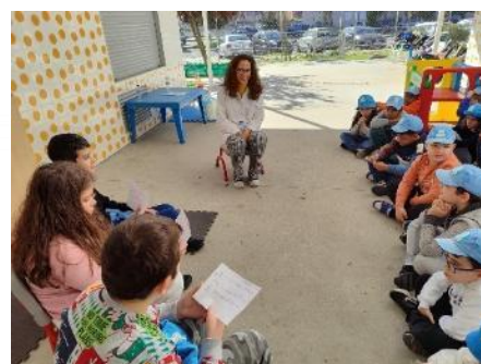
Atividades no âmbito do Projeto “Crevide News”

Ainda durante o mês de março, foram realizadas atividades comemorativas da Páscoa, incluindo a confeção de lembranças e uma caça aos ovos. Utilizando materiais diversos, as crianças participaram na criação de lembranças de Páscoa. Esta atividade teve como objetivo desenvolver habilidades motoras