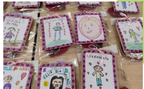
Atividades Dia da Mãe