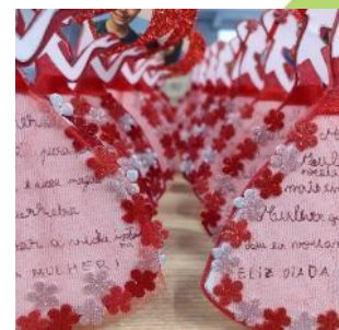
Celebrações dia do Pai e do dia da Mulher