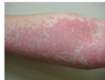
Figura 1 – Urticária em membro superior

- Urticária: lesões maculo-papulares avermelhadas, que podem ser pequenas e surgir de forma isolada ou agrupar e formar placas avermelhadas. Estas pápulas são acompanhadas de comichão e surgem acompanhadas de ardor, podendo permanecer na pele durante horas (Venereologia, 2019). A urticária não deixa lesões na pele (SPAIC, 2019).