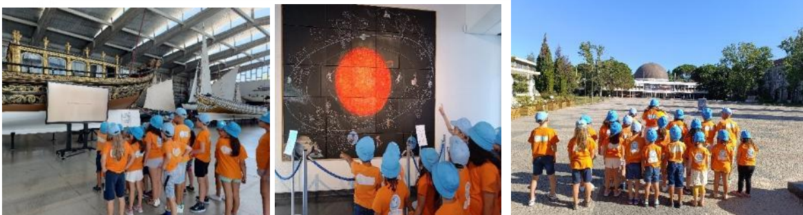
Colônia Praia – atividades no exterior CATL+ JI

Estas atividades ao ar livre e visitas educativas são fundamentais para o desenvolvimento integral das crianças, promovendo a aprendizagem ativa e a exploração do ambiente natural e cultural. Elas contribuem para o fortalecimento das habilidades sociais, cognitivas e motoras, alinhando-se com os objetivos pedagógicos estabelecidos no Plano Anual de Atividades.